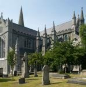
Saint Patrick's Cathedral

Exceptionnelle visite, tant pour le fameux livre que pour la bibliothèque