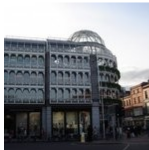
St. Stephen's Green

Petits commerces dans un superbe bâtiment