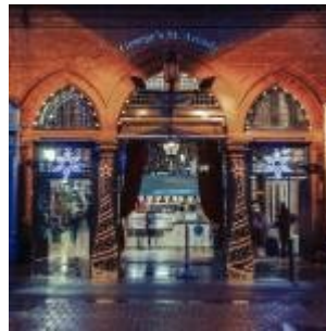
George's Street Arcade