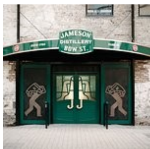
Jameson Distillery Bow St

Excellente visite guidée même si la production ne se fait plus sur place.