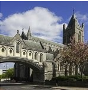
Christ Church Cathedral

Superbe cathédrale tant à l'extérieur qu'à l'intérieur.