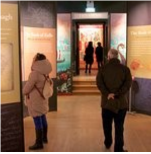
The Book of Kells and the Old Library Exhibition

Exceptionnelle visite, tant pour le fameux livre que pour la bibliothèque